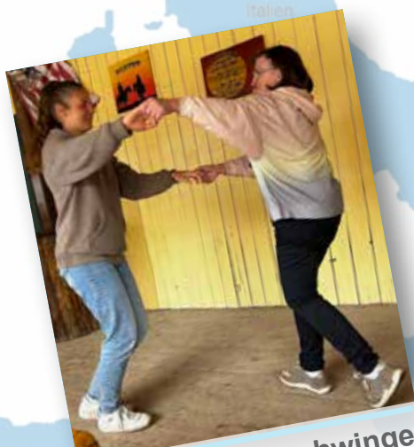
das Tanz-bein schwingen