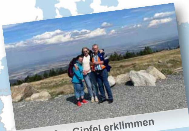
den Gipfel erklimmen